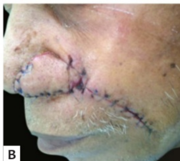
FIGURA 2: A - Enxerto de cartilagem retirado da concha da região auricular posterior esquerda, suturado com fios 5-0 inabsorvíveis. B - Defeito fechado com suturas interrompidas, utilizando-se fios 5-0 inabsorvíveis.