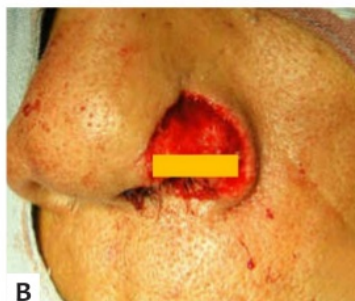
FIGURA 1: A - Desenho em forma trapezoide. B - Defeito por carcinoma basocelular localizado na asa nasal esquerda, medindo 2cm de diâmetro.